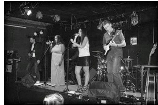
[Les Cannois sont formidable]